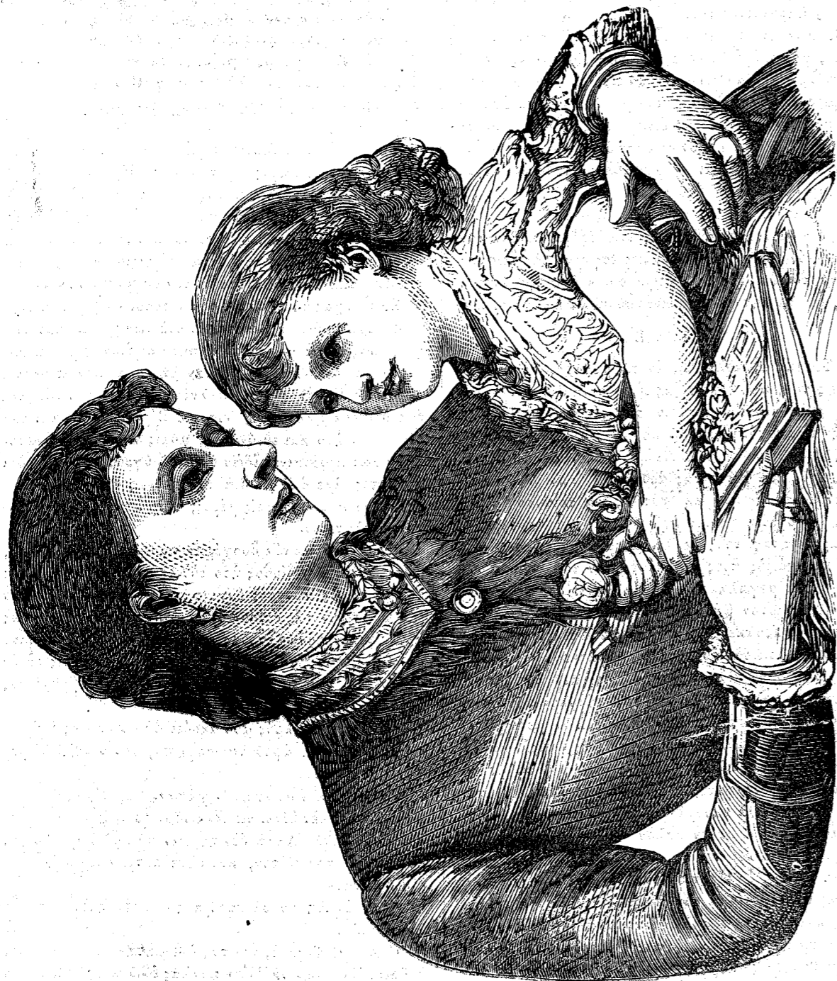
Ἡ Πριγκίπισσα ΑΛΙΚΗ.

«Καλὰ! ἀφοῦ τὸ ἐγκρίτης», εἶπεν ὁ Βέρνερ, «πολύ καλὰ, θὰ ἦσαι ὑπεύθυνος, ἐὰν ὄλοι οἱ κόποι καὶ οἱ ἀ-